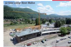
Le futur collège Henri-Wallon