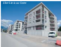
L'ilot G de la zac Centre