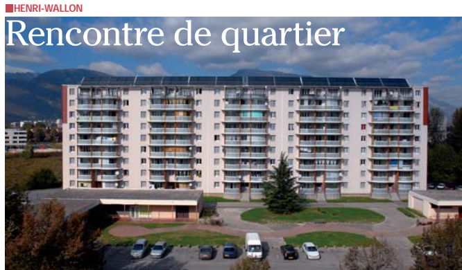
C'est reparti pour une nouvelle série de rencontres entre élus et habitants dans les quartiers martinérois : lancement le samedi 20 juin à "Henri-Wallon" !