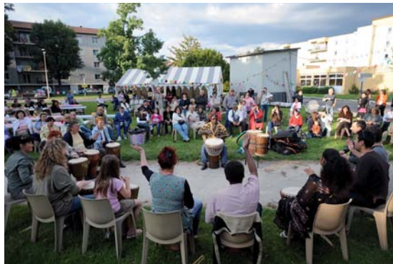
année : “Le parc urbain : quelle perception pour quel usage ?” a donc été choisi dans ce but. “Il s'agit de s'interroger sur les utilisations que chacun peut avoir du parc urbain ou des pores situés en pied d'immeubles, car elles sont différentes d'un habitant à un autre : ils peuvent faire parti d'un cadre de vie, ils peuvent être un espace social de rencontres, de jeux, de détente, des lieux de promenade, de passage ou ils peuvent être un élément d'amélioration environnementale...” précise Claire Tranchant. Pour agencement tout cela, plusieurs animations seront proposées le jour J à partir de 17 h 30 place Karl-Marx : initiation hip-hop, chorale de l'école Paul-Langevin, déambulations du théâtre de rue avec “Les décalogues” , danse avec la compagnie Cidance et pour finir sur une note festive, un bal populaire animé par un DJ. “Une programmation entièrement dédoublée par les habitants” , ajoute Claire Reuzé-vois est donc pris le 20 juin à partir de 17 h 30 place Karl-Marx pour la 5 e édition d'En musique les voisins. ACB

nombre d'habitants à sa réussite. “Une fois l'événement terminé, on en fait le bilan avec tous les participants et on attaque l'édition suivante sur la lancée” , explique Claire Tranchant, pilote du projet. Cette année revêt un caractère spécial puisque l'initiative a pour objectif d'être une passerelle avec l'inauguration du parc Jo-Blanchon prévue pour 2010. Le thème de cette