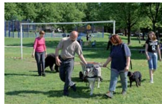
Il Concernant la journée du 13 juin, un travail en direction des élèves du collège Henri-Wallon est mené avec la classe de 4 4. “On travaille sur le regard, différent selon les personnes, que l'on peut avoir d'un chien, sur ce qu'il est réellement. L'idée est que ces jeunes aient une autre vision du chien, une fois le