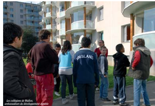
Les collégiens de Wallon, ambassadeurs du développement durable