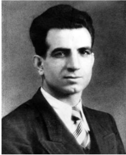
Missak MANOUCHIAN (1906-1944) Poète et résistant arménien. Organisateur d'un très actif réseau en France. Il fût fusillé par les allemands avec ses camarades de combat en février 1944. L'affiche rouge témoigne de cette action.