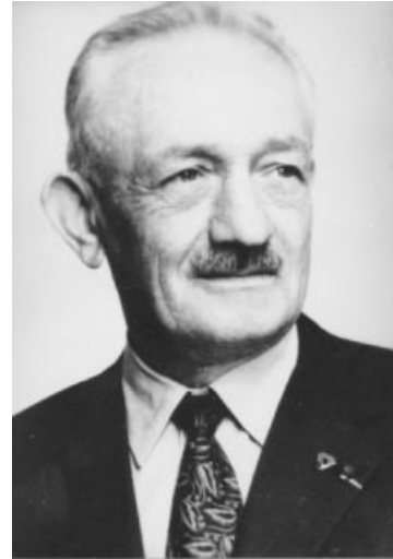
Eugène Chavant (1894-1969) "Clément" dans la résistance , maire socialiste en 1938, destitué en 1941 par Vichy. Entre en résistance, il devient le chef civil et l'organisateur des maquis du Vercors. Malgré un voyage à Alger, il n'obtiendra pas les armes nécessaires pour faire face à l'armée allemande.. Réélu maire à la libération, sur une liste d'Union de la résistance. Démissionnera le 4 juillet pour raisons de santé.