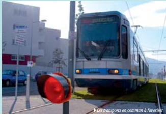
Les transports en commun à favoriser

- le renforcement de la démocratie et de la décentralisation, et engage une simplification des règles de manière à les rendre accessibles à chacun, privilégiant le dialogue et le débat public ●