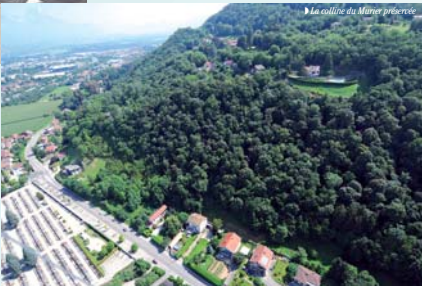
La colline du Marier préservée

Le Plu doit respecter les consignes données par différents documents de rang supérieur élaborés par l'État ou d'autres collectivités territoriales, dans une relation de compatibilité verticale ascendante : lois Montagne et Littoral, directive territoriale d'aménagement, schéma de cohérence territoriale, Programme local de l'habitat, Plan de déplacements urbains, les chartes des parcs régionaux, la charte de développement du pays, le schéma d'aménagement et de gestion des eaux... ●